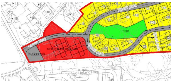
Figur 2: Utsnitt som viser deler av reguleringsplan for Kjersti park som blir berørt av planområdet.

Kartet i figur 2 viser utsnitt av reguleringsplan for Kjersti park. Arealformålene som blir berørt er bebyggelse og anlegg: Parkering (grått), Offentlig område (rødt) og Vegformål (grått).