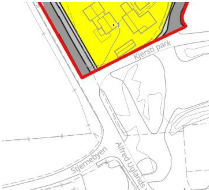
Figur 4: Kartutsnitt av reguleringsplan for Evje sentrum.

Kartet i figur 4 viser et utsnitt av reguleringsplan for Evje sentrum, der en liten del berøres av foreslått nytt planområde. Arealformål som berøres er bebyggelse og anlegg: kjøreveg (grått) og annet vegareal (lys grå).