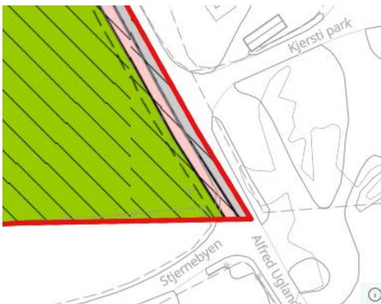
Figur 3: Utsnitt som viser del av detaljregulering for Støperitomta.

Kartet i figur 3 viser et utsnitt av detaljregulering for Støperitomta, der en liten del berøres av foreslått nytt planområde. Arealformål som berøres er bebyggelse og anlegg: fortau (rosa) og veg (grått).